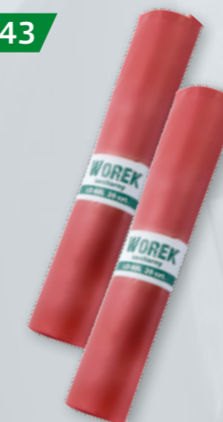
WORKI NA ODPADY MEDYCZNE Pojemność 35/60/120 l