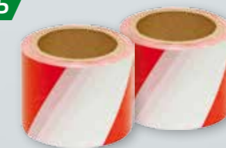
TAŚMA OSTRZEGAWCZA Biało-czerwona, 7 cm x 100 m