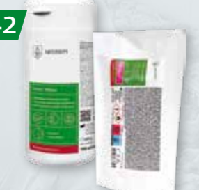
VELOX DUO WIPES Alkoholowe chusteczki dezynfekcyjne do powierzchni Op. 100 szt. tuba / wkład Zapach: tea tonic