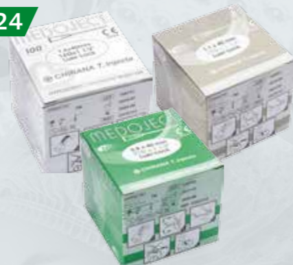
IGŁY INIEKCYJNE Sterylne, jednorazowe Różne rozmiary Op. 100 szt.