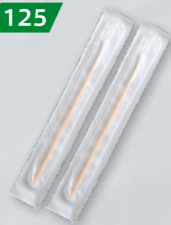
WYMAZÓWKI BEZ PODŁOŻA W BLISTRACH Op. 100 szt.