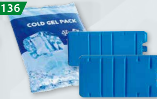
WKŁADY CHŁODZĄCE DO LODÓWEK PRZENOŚNYCH Plastikowe z płynem 200 ml/400 ml Żelowe 450 g