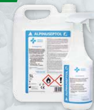
ALPINUSEPTOL 1 L, 5 L Preparat do szybkiej dezynfekcji powierzchni Zapach: neutral, zielona herbata