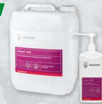
VELODES SOFT 0,5 L, 5 L Płyn do higienicznej / chirurgicznej dezynfekcji rąk