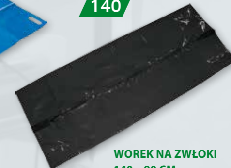
WOREK NA ZWŁOKI 140 x 90 CM Czarny