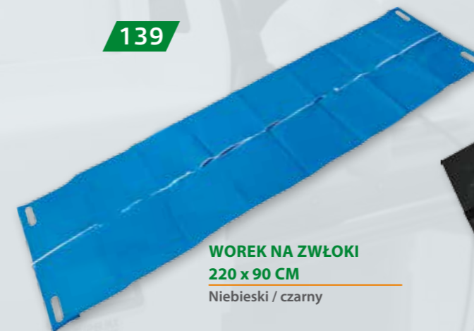
WOREK NA ZWŁOKI 220 x 90 CM Niebieski / czarny