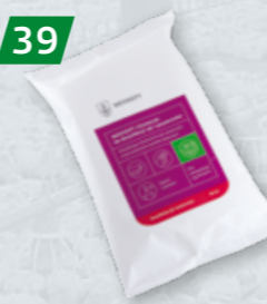
MEDISEPT CASHMERE Alkoholowe chusteczki dezynfekcyjne do rąk i powierzchni, zapachowe Op. 50 szt.