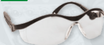
OKULARY OCHRONNE SAFEGUARD PW35 Z dwustopniową regulacją