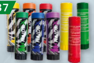
KREDKI RAIDEX MAXI / ARTWET MAXI DO ZNAKOWANIA ZWIERZĄT Różne kolory