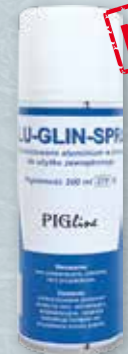
ALU-GLIN-SPRAY 200 ML Spray odkażająco-ochronny na rany