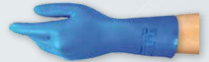
RĘKAWICE GOSPODARCZE NITRYLOWE ANSELL ALPHATEC 37-310 Rozmiar S - XL