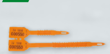
PLOMBY PASKOWE PODWÓJNE Z NUMERACJĄ Numeracja według zamówienia klienta