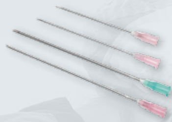
IGŁY DO POBIERANIA KRWI U ZWIERZĄT Sterylne, jednorazowe Różne rozmiary Op. 100 szt.