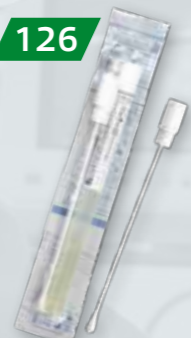
WYMAZÓWKI Z PODŁOŻEM STUART Na bakterie Op. 100 szt.