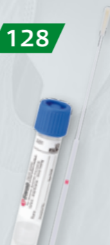
WYMAZÓWKI Z PŁYNNYM PODŁOŻEM AMIES Na bakterie i wirusy Op. 50 szt.