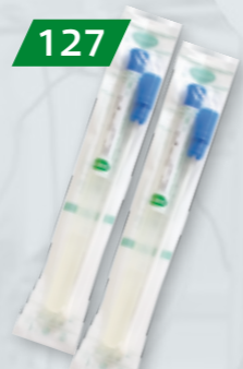
WYMAZÓWKI Z PODŁOŻEM AMIES Na bakterie Op. 100 szt.