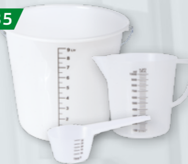
MIARKI DO SPORZĄDZANIA ROZTWORÓW Pojemność 30 ml/1 l/10 l