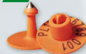
KOLCZYKI TRZODOWE NUMEROWANE Numeracja według zamówienia klienta