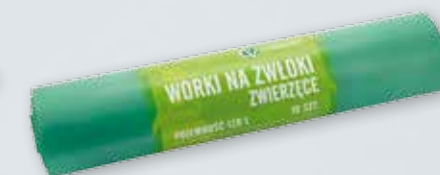
WORKI NA ZWŁOKI MAŁYCH ZWIERZĄT Wymiary 110 x 70 cm Pojemność 120 l Grubość folii 60 µm Rolka 10 szt.