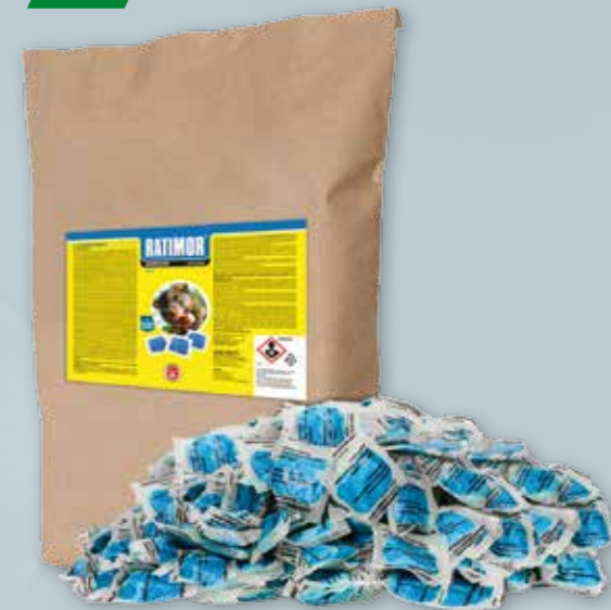
TRUTKA NA GRYZONIE PASTA RATIMOR OP. 25 KG