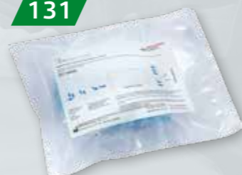
ZESTAW DO POBIERANIA PRÓB NA SALMONELLĘ Z BUFOREM 2 lub 5 par nakładek na buty