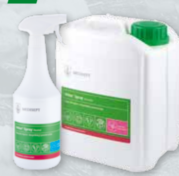
VELOX SPRAY 1 L, 5 L Płyn do dezynfekcji powierzchni Zapach: neutral