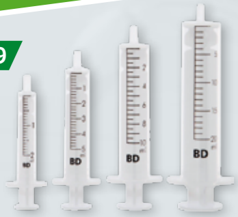
STRZYKAWKI JEDNORAZOWE Pojemność 2/5/10/20 ml