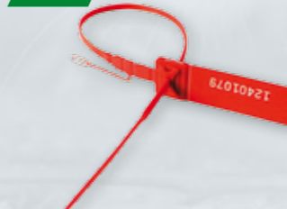
PLOMBY LINKOWE Z NUMERACJĄ Numeracja według zamówienia klienta