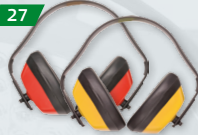
NAUSZNIKI PRZECIWAŁASOWE PW40 CLASSIC