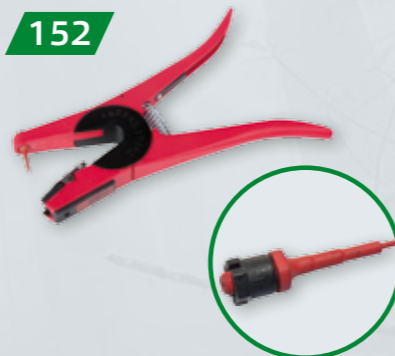
KOLCZYKOWNICA UNIWERSALNA ALLFLEX W komplecie igła zapasowa Możliwość dokupienia samej igły