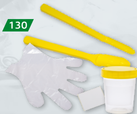
ZESTAWY NA TSE / BSE Op. 20 szt.