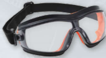
GOGLE OCHRONNE ULTRALEKKIE PW26