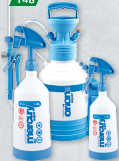
OPRYSKIWACZE KWAZAR Pojemność 0,5/1/2/3/6/9/12 l