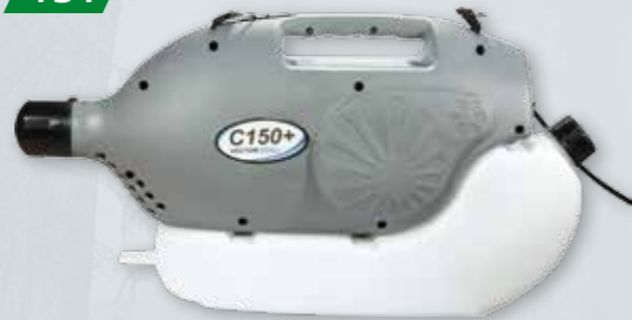
ZAMGŁAWIACZ ELEKTRYCZNY C150+ VECTORFOG Przenośny profesjonalny zamgławiacz

Zastosowanie: • dezynfekcja i dezynsekcja biur, szkół, hoteli, galerii handlowych • może być stosowany jako nawilżacz powietrza