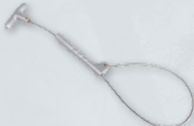
PĘTLA POSKROMU TYPU KORT