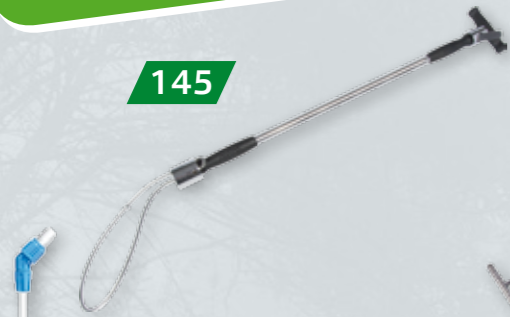
PĘTLA POSKROMU 600 MM Z blokadą i gumowymi nakładkami