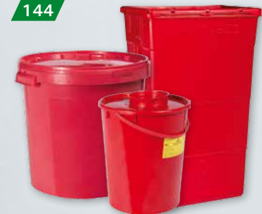
POJEMNIKI NA ODPADY MEDYCZNE Pojemność 2/5/10/20/30/60 l