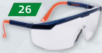
OKULARY OCHRONNE CLASSIC SAFETY PLUS PS33 Mogą być używane razem z okularami korekcyjnymi