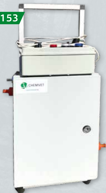
URZĄDZENIE DO CIŚNIENIOWEGO MYCIA LINII POJENIA Wspomaga usuwanie biofilmu oraz pozostałości po produktach leczniczych