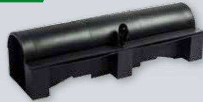
KARMIK DERATYZACYJNY DUŻY TUNEL Szczury, myszy