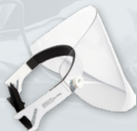
PRZYŁBICA ZONA PRO Podnoszona Odporna na zarysowania