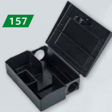
KARMIK DERATYZACYJNY Myszy