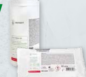
VELOX WIPES NA Bezalkoholowe chusteczki dezynfekcyjne do powierzchni Op. 100 szt. tuba / wkład