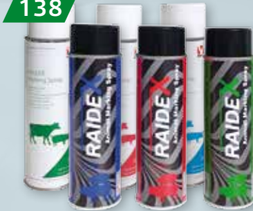
SPRAY RAIDEX / KRUUSE DO ZNAKOWANIA ZWIERZĄT 500 ML 3 kolory