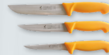
ZESTAW NOŻY RZEŹNICZYCH 3 SZT.