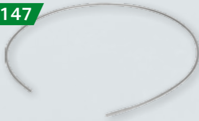
LINKA DO POSKROMU Ø 5MM, DŁ. 1M Ocynkowana lub ze stali nierdzewnej