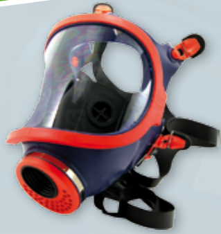
MASKA PEŁNOTWARZOWA CLIMAX 731-S, 731-C Ochrona układu oddechowego, oczu i twarzy w skażonym środowisku