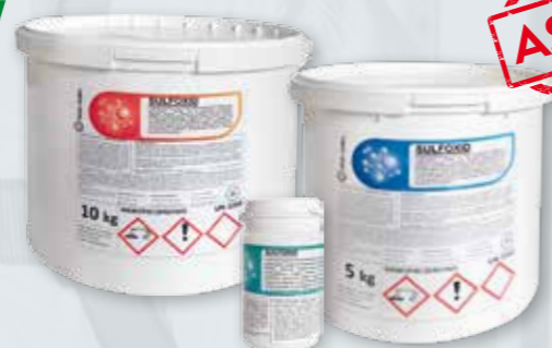
SULFOXID 100 G, 5 KG, 10 KG Preparat dezynfekcyjny o działaniu bakterio-, grzybo- i wirusobójczym