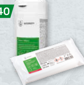
VELOX WIPES Alkoholowe chusteczki dezynfekcyjne do powierzchni Op. 100 szt. tuba / wkład