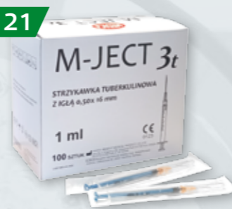
STRZYKAWKI JEDNORAZOWE DO TBC Z IGŁĄ Op. 100 szt.