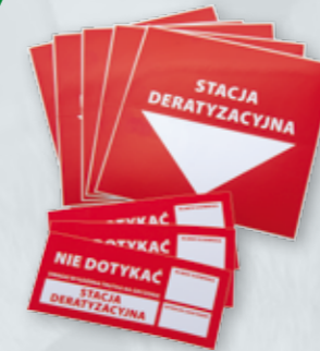
NAKLEJKI OSTRZEGAWCZE Na ścianę i na stację deratyzacyjną