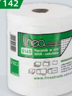
RĘCZNIKI PAPIEROWE LINEA MAXI 150 mb, śr. 190 mm, 2 warstwy Op. 6 rolek