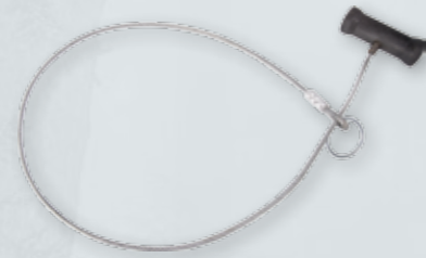
PĘTLA POSKROMU TYPU TROPS