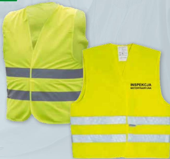
KAMIZELKA ODBŁASKOWA Możliwość wykonania kamizelek z własnym logo klienta Rozmiar L - XXXL