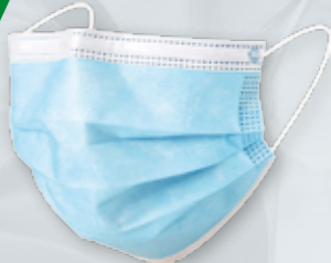
MASKI 3-WARSTWOWE MEDYCZNE Op. 50 szt.