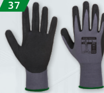
RĘKAWICE ROBOCZE DERMIFLEX AQUA Powlekane nitylem Wodoodporne Rozmiar L - XXL