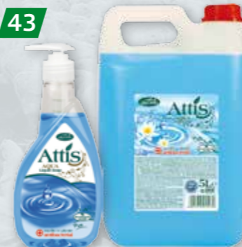
ATTIS 400 ML, 5 L Mydło antybakteryjne (zapachowe)