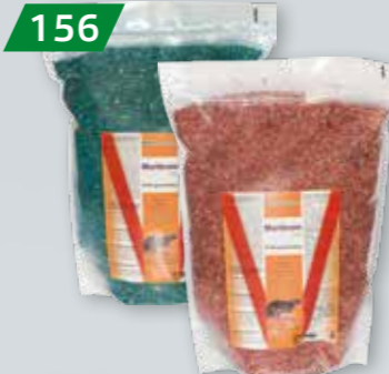
TRUTKA NA GRYZONIE - ZIARNO MURIBROM 3 KG