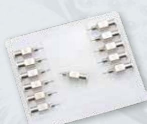
IGŁY DO TBC 0,7 x 4 MM Wielorazowego użytku Op. 12 szt.