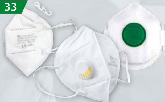
PÓLMASKI FFP2 / FFP3 Różne rodzaje Chronią przed aerozolami, pyłami, mgłami