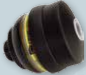
FILTROPOCHŁANIACZ GAZOWY 725 A2B2E2K2P3 (DO MASKI CLIMAX 731-S, 731-C) Chroni przed gazami, parami, pyłami