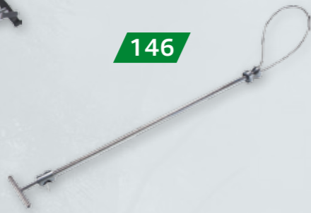
PĘTLA POSKROMU 600MM Z blokadą