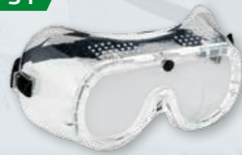
GOGLE Z WENTYLACJĄ BEZPOŚREDNIA PW20