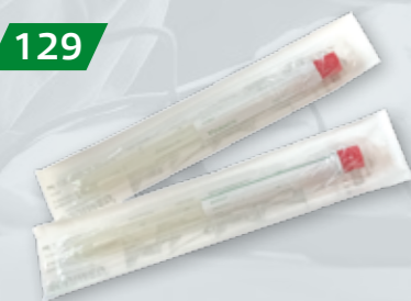
WYMAZÓWKI BEZ PODŁOŻA W PRÓBÓWKACH TRANSPORTOWYCH Op. 100 szt.