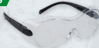
OKULARY OCHRONNE PS30 Do używania z okularami korekcyjnymi