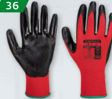
RĘKAWICE ROBOCZE FLEXO GRIP Powlekane nitylem Rozmiar L - XXL